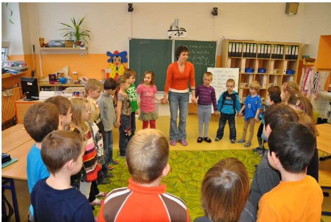
Obrázek 2 - Ilustrační foto seznamování a nácviu společného pozdravu