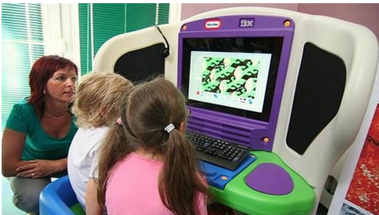
Obrázek 19 – Příklad PC učebny pro realizaci aktivit na počítači v rámci metodiky MSN (SSZŠ Litvínov)