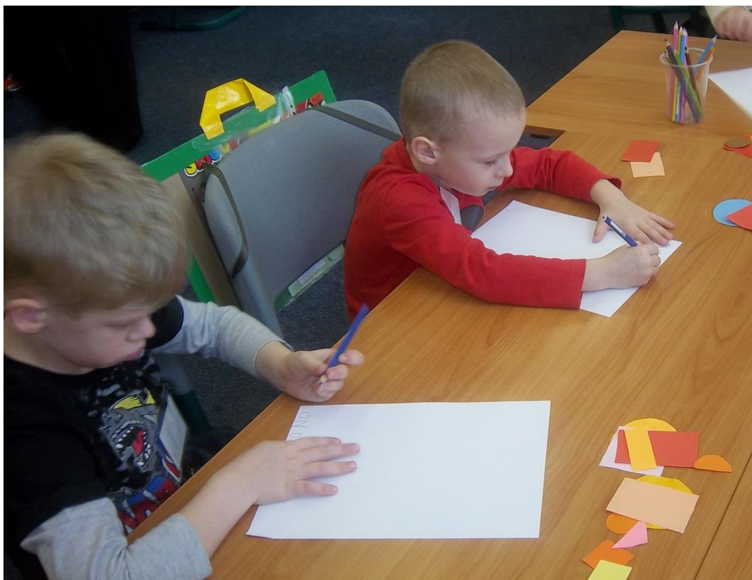
Obrázek 6 – Ilustrační foto procvičování geometrických tvarů