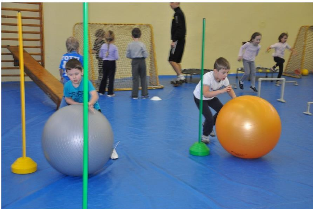
Obrázek 12 – Ilustrační foto procvičování hrubé motoriky v tělocvičně