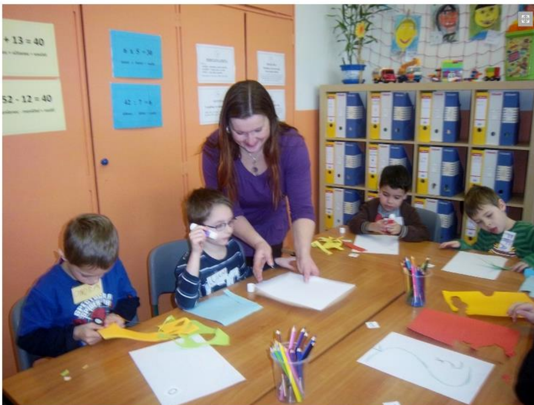
Obrázek 15 – Ilustrační foto procvičování písmen