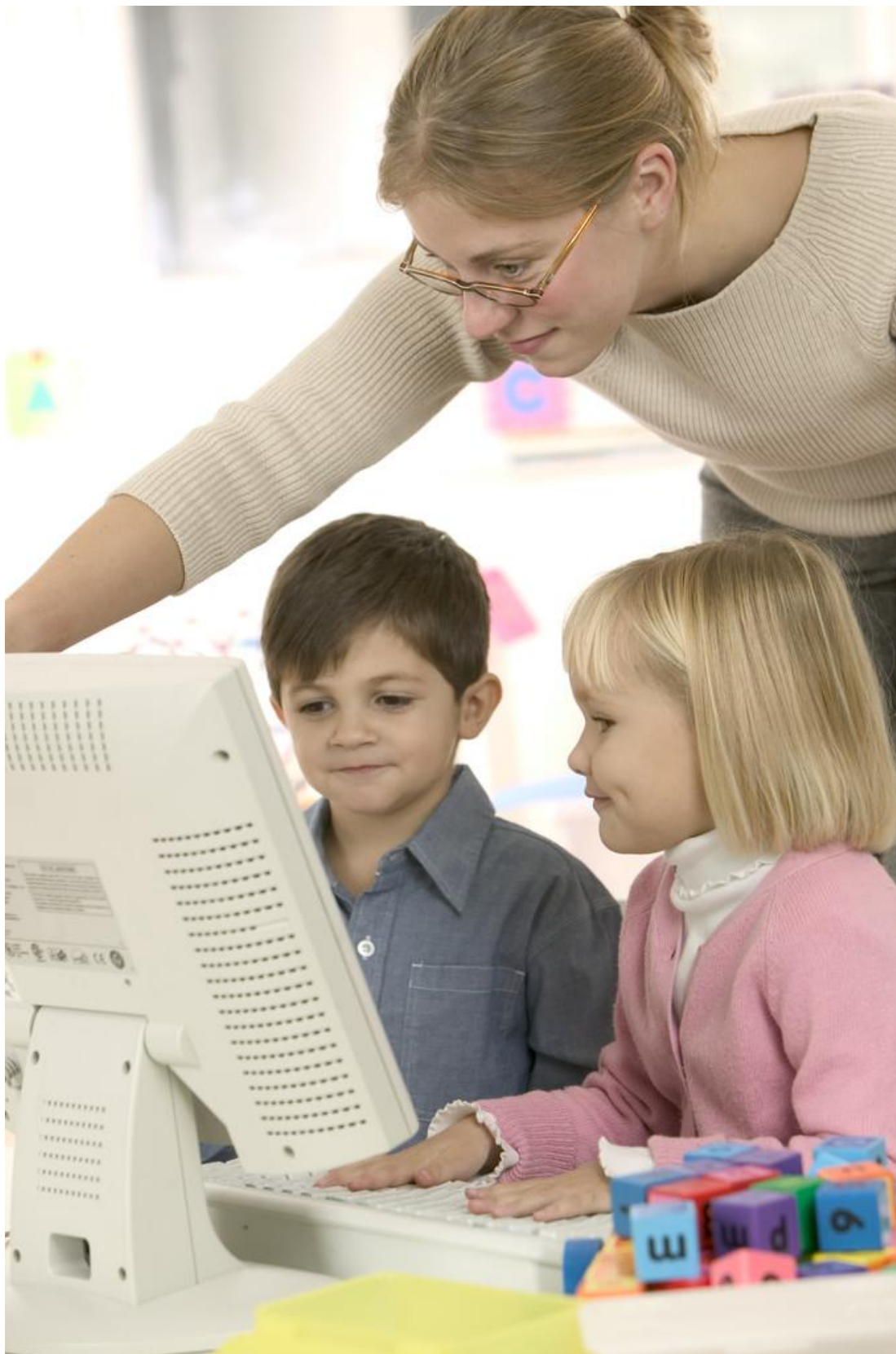
Obrázek 17 – Ilustrační foto práce předškolních dětí na počítači, vždy je důležitý dohled dospělé osoby