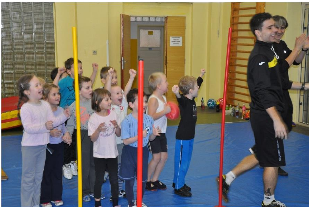
Obrázek 10 – Ilustrační foto procvičování hrubé motoriky v tělocvičně