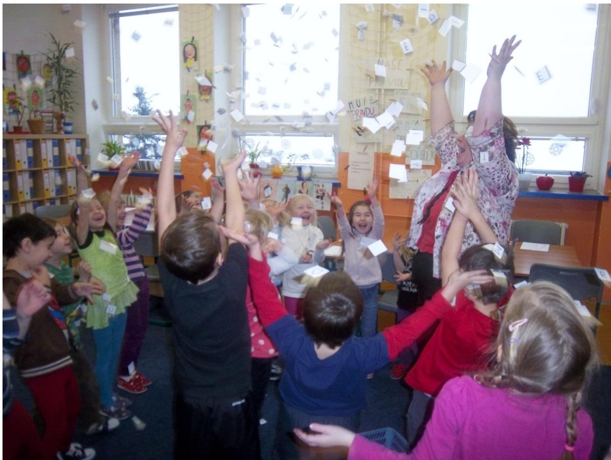
Obrázek 3 – Ilustrační foto procvičování jemné motoriky