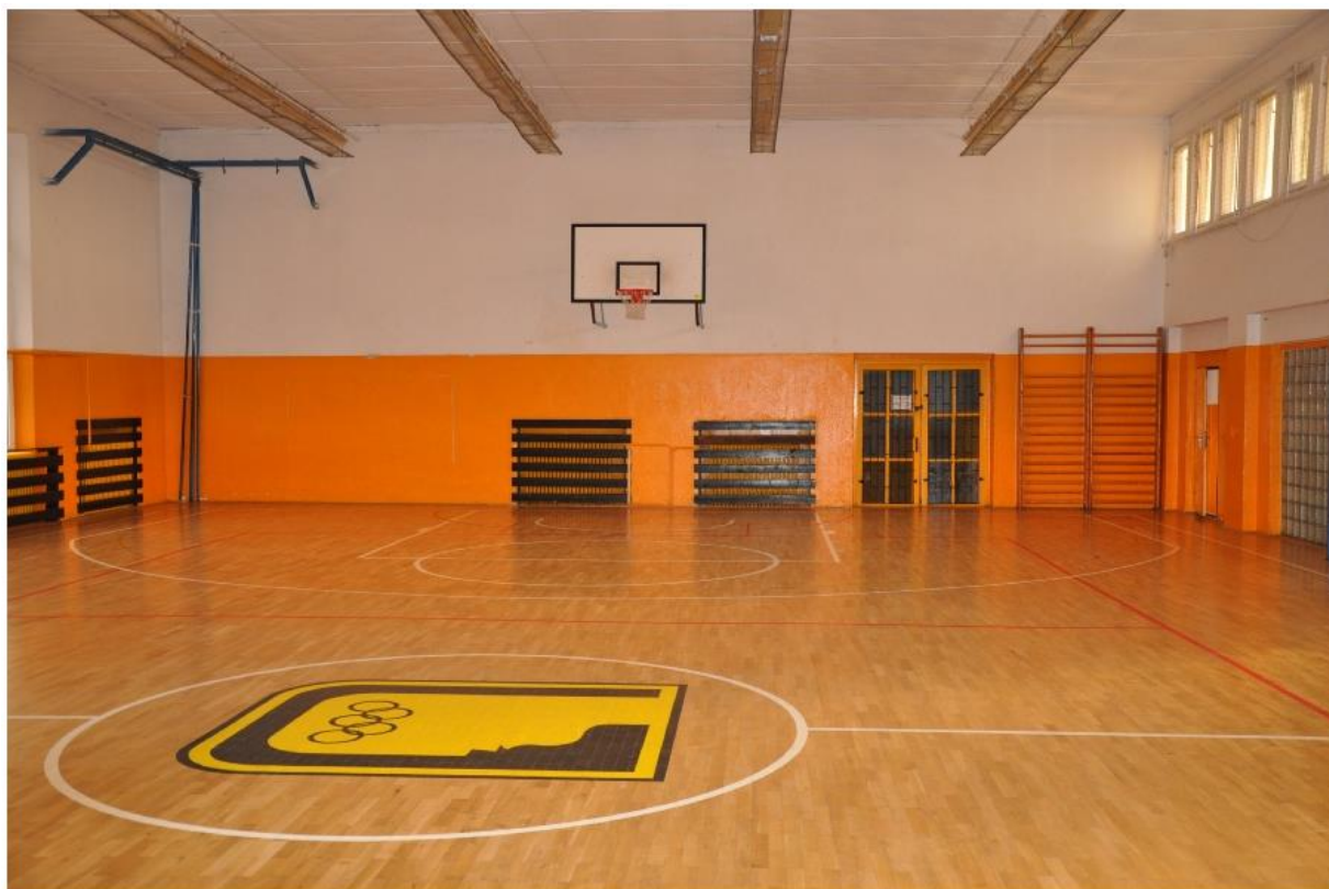
Obrázek 8 – Ilustrační foto pro setkání v tělocvičně (SSZŠ Litvínov)